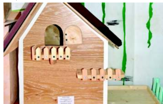
школа № 42.