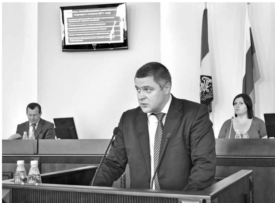
Отчет мэра – на сайте городской администрации shakhty-gorod.ru

Достижение таких объемов стало возможным благодаря успешной реализации ряда программ. Например, по программе местного